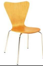
Chaise GRACE bois CCO210