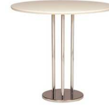
Table CHAILLOT blanc TCW997 Ø 80 x H. 72 cm 80€ HT