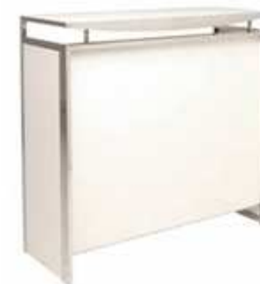
Comptoir CHAMONIX blanc PWW001