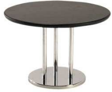
Table basse CHAILLOT noir TCN963 Ø 60 x H. 40 cm 65€ HT