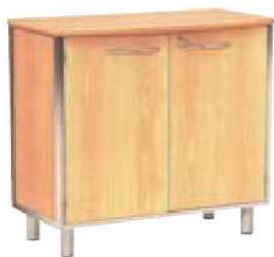
Rangement CROISSETTE bois RCH900