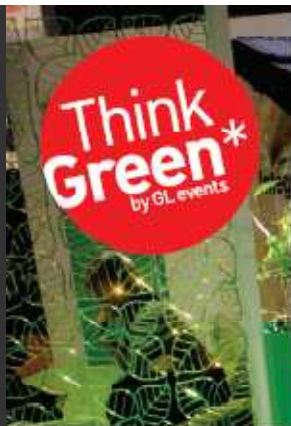
* Pensez vert