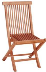
Chaise TECK bois COO122