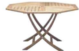
Table TECK bois octogonale pliante TOO909 Ø 110 x H. 75 cm 136€ HT