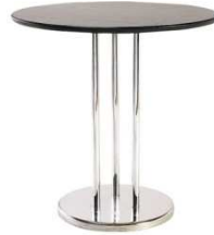
Table CHAILLOT noir TCN996 Ø 80 x H. 72 cm 80€ HT