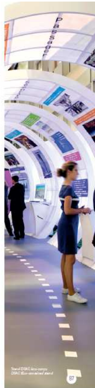
Stand D&C éco-conçu D&C Eco-Designed stand

WASTE RE-USE AND MANAGEMENT Our commitments: • Limit the final waste produced by resorting systematically to re-usable products and recycled or recyclable materials. • Reinforce the recycling sorting on our sites. • Lengthen the average life of our products, without reducing their level of quality via our maintenance and cover work shops. • Increase the awareness of all our employees concerning their eco-behaviour.