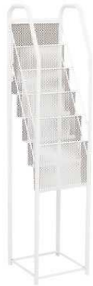
Présentoir DUPONT blanc PWW897