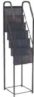
Présentoir DUPONT noir PNN897