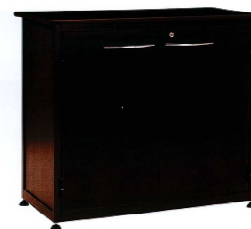
Rangement BRISTOL noir RNN001