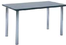
Table HERMES noir TCN917 L. 130 x l. 75 x H. 76 cm 89€ HT