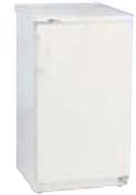
Réfrigérateur 140L GCW503