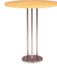
Table CHAILLOT bois TCH996 Ø 80 x H. 72 cm 80€ HT