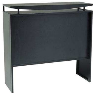
Comptoir BRINKS noir PNN856