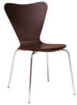
Chaise GRACE noir CCN001