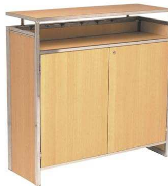
Comptoir CROISSETTE bois PCH860