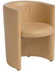
Fauteuil RONDO beige FEE484