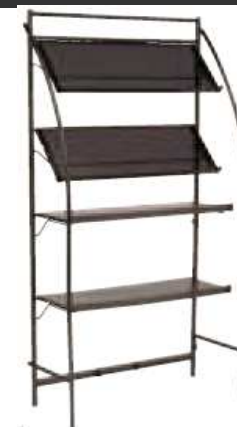
Etagère PYC noir PNN841