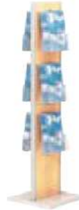
Présentoir MOULINSART bois PCH101