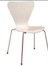
Chaise GRACE blanc CCW001