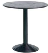
Table LOUXOR TNN989 Ø 80 x H. 74 cm 78€ HT