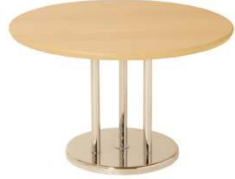
Table basse CHAILLOT bois TCH963 Ø 60 x H. 40 cm 65€ HT