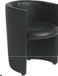
Fauteuil RONDO noir FNN447