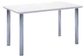
Table HERMES blanc TCW941 L. 130 x l. 75 x H. 76 cm 89€ HT