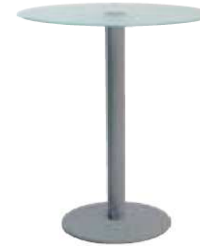
Mange debout verre STAND UP TGT003 Ø 80 x H. 110 cm 118€ HT