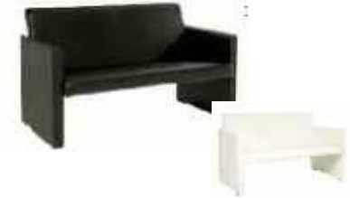
Canapé MISTER HALL